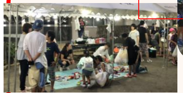
新登場のコーナー、どれだけ冷たい氷を持てるかな？ガマン比べだよ！