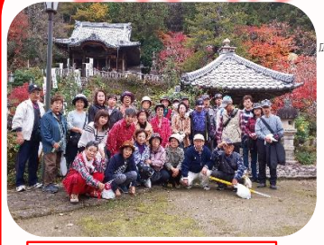
三田洞弘法さんの古刹の風情ある漂いを背景に集合写真を撮りました。