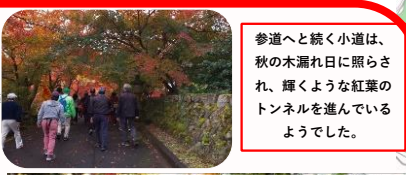
参道へと続く小道は、秋の木漏れ日に照らされ、輝くような紅葉のトンネルを進んでいるようでした。