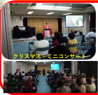
クリスマス・ミニコンサート

岩野田北自慢 岩野田北はこんなまち・・・川はきれいで山々の緑も季節のたびに美しく変化します。恵まれた自然とともに子供たちはのびのびと周りの大人たちと仲良く過ごすことのできるまち。多くの医療機関やスーパーも立地し、生活利便性の高い地域の魅力を発信していきます。 令和2年度よりホームページ開設予定（トップページより掲載）