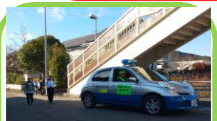
青色防犯パトロール隊。各自治会長さんを中心に、防犯活動を推進しています。