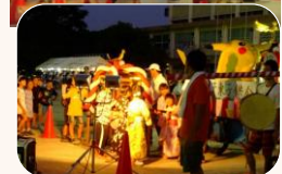
フィナーレには子供たちも一緒に、掛け声と共に、担ぐことができました。