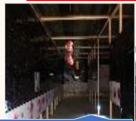
おばけやしき迷路型クイズラリー