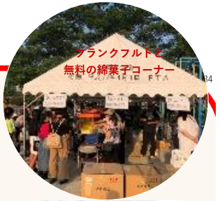
ブランケットと無料の綿菓子コーナー