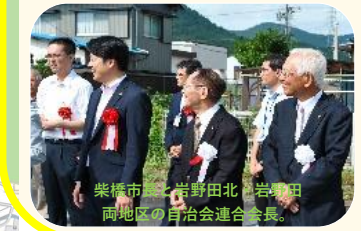
柴橋市長と岩野田北、岩野田両地区の自治会連合会長。