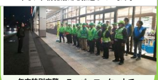
年末特別夜警、スーパーマーケットで買い物客に防犯啓発活動実施。