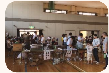
ゴールでは、クラス別にクイズの採点結果を競いました。