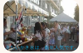
値段の手ごころもあり、前売券ですぐに売り切れる焼きそば。今年も早々に完売しました。