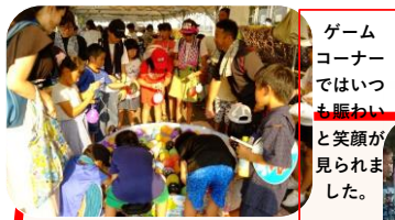
ゲームコーナーではいつも賑わいと笑顔が見られました。