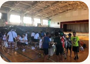
スタート地点、ワクワクしながら受付を待つ親子連れ。怖くはないのかな？