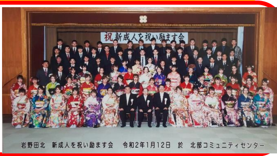
祝新成人を祝います会