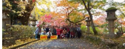
参道の帰路、紅葉の風景が名残惜しく、つい記念写真を撮りました。

岩野田北自慢 岩野田北はこんなまち・・・川はきれいで山々の緑も季節のたびに美しく変化します。恵まれた自然とともに子供たちはのびのびと周りの大人たちと仲良く過ごすことのできるまち。多くの医療機関やスーパーも立地し、生活利便性の高い地域の魅力を発信していきます。 令和2年度よりホームページ開設予定（トップページより掲載）