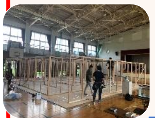
昨年以上にグレイドアップされた「迷路」子供たちの喜ぶ顔を浮かべながら、額に汗を流して、準備作業にとりかかりました。