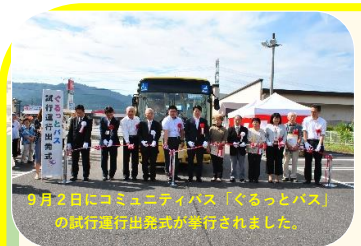
9月2日にコミュニティバス「くるっとバス」の試行運行出発式が挙行されました。