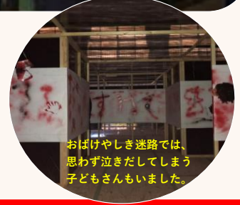
おばけやしき迷路では、思わず泣きだしてしまう子どもさんもいました。