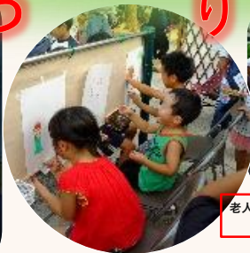
老人クラブの新企画「お絵描きコーナー」・・・みんな何を書いてるのかな？