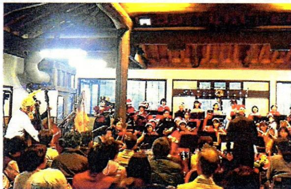
▲四季の森センター(☎237-6677)では、コンサート森の音楽会が、月1回程度開催されています。

岐阜市北東部に位置し岐阜市最高峰の百々ヶ峰(417.9m)を擁しています。管理区域 233haの中には約 20km の遊歩道と約 8km の管理道が整備されており、自然観察・森林浴・キャンプ・ハイキング等、四季を通して楽しむことができます。四季の森センター(三田洞字日向平 211)では、各種イベントが随時、企画開催されます。【定休日】月曜日(祝祭日は翌日)・年末年始