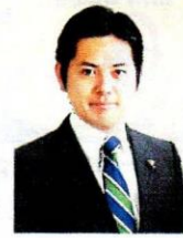
岐阜市長 柴橋正直

日頃は、市政に格別なご理解とご協力を賜り、厚く御礼申し上げます。岩野田・岩野田北地区コミュニティバス「ぐるっとバス」の試行運行開始にあたり、一言ご挨拶を申し上げます。