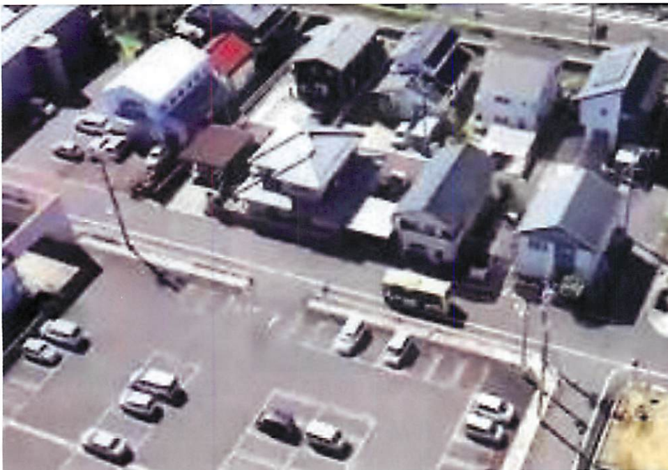
▲ドローンによる空撮動画より(撮影：令和2年9月28日)

本格運行は、コロナの影響を考慮して、1年先の令和4年4月となりますが、地域の皆様が大いに利用され、地域の足として、無事に本格運行に移行できるよう、皆様のご協力をお願いします。