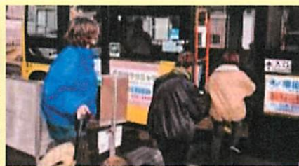
▲三田洞団地集会所