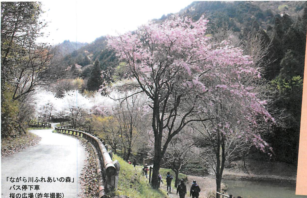
「ながら川ふれあいの森」 バス停下車 桜の広場(昨年撮影)

令和元年9月に試行運行を開始した“ぐるっとバス”は、皆様のご理解・ご協力のおかげをもちまして、本格運行の条件を達成できました。いよいよ、この4月から本格運行が始まります。利用方法などに変更はありませんが、3年間継続して運行できます。今後は、判断期間（2年目の12月から3年目の11月までの1年間）の運営状況を踏まえ、継続判断がなされます。本格運行への移行を契機として、運営基盤の強化、利便性の向上にさらに取り組んでいくためにも、引き続き、皆様のご利用、ご協力をよろしくお願いいたします。