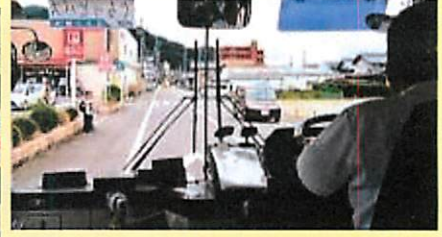
▲トミダヤ三田洞店(車内撮影)

<お知らせ> 65歳以上の方がコロナワクチン接種のため、コミバスを利用される際、