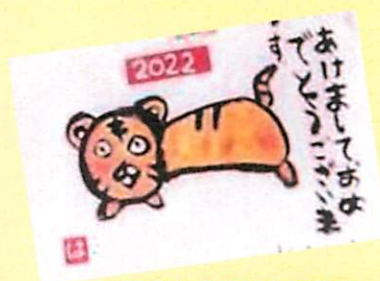
▲児童から届いた年賀状

毎年 11 月に 1 週間にわたり乗降調査が行われます。昨年に続き、トミダヤ三田洞店、パロ栗野店と三田洞集会所がトップスリーに、そして団地 7 棟南が 6 番目の利用です。そのほか、兎ヶ洞東公園や兎ヶ洞中公園など三田洞団地に方々の利用が目立ちます。通信 9 号の三田洞団地集会所の写真は、1 月 24 日(月) 2 便(左回り)の乗車の様子です。4 人の方が待っておられ、トミダヤへ買い物に行く常連の方でした。●コミバスや岐阜バスを利用して花見をする、それも弁当などを持ってという、のんびり感があって良いのではないのでしょうか。中将姫誓願桜(願成寺)も載せたい所でしたが、コミバスの帰りの乗り継ぎうまくいかず断念しました。乗り継ぎを考えたコミバス運行が期待されます。