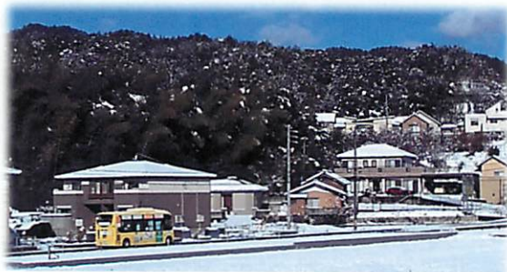
▲雪の日もがんばっています。(令和3年師走)

また、道路が狭い岩崎山手地区に4月4日から導入したサポート便の利用者は、6月30日時点で延べ14人となっています。