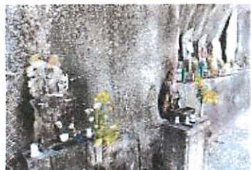
▲岩崎の不動明王と役行者崩落防止工事の際、頭上の岩壁から現在地に移設された。「戸羽川」下車・アルコ東