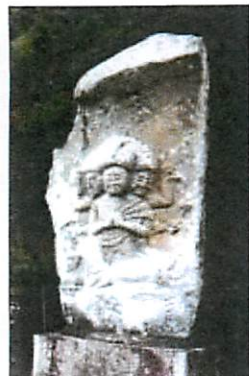
▲(左)三田洞弘法参道入口の馬頭観音「三田洞神仏温泉」下車、その少し北の(右)十王堂前の地藏菩薩(1804)