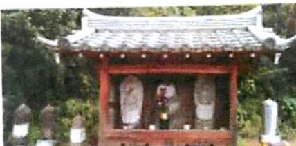
▲粟野西・済法寺の青面金剛庚申像(1763 年)など「済法寺大門」下車