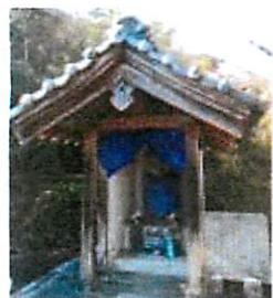
▲粟野西月野の石仏(1799 年) 歯の痛みを治すお地藏様として、遠方からもお詣りがあった。「岩野田公園」下車・南へ

岩崎、粟野西・東、三田洞には、知られているだけでも合わせて 117 体の石仏があります。地藏菩薩をはじめ、馬を飼う農家が多かったことから、馬の霊を祀る馬頭観音が多くみられます。