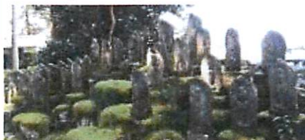
▲岩崎・靈松院の門前左の集合仏「靈松院前」下車