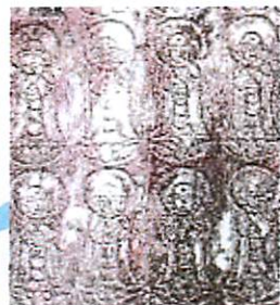
▲粟野東・大龍寺参道入口北側の線画の地藏千体佛「スギ薬局粟野東店」下車

【参考文献】「岩野田の石仏Ⅰ・Ⅱ集」(「岩野田の歴史を語る会」編・H15、H18 発行)、「埋もれゆく路傍文化」(「岐北ライオンズクラブ」編・S61 発行)