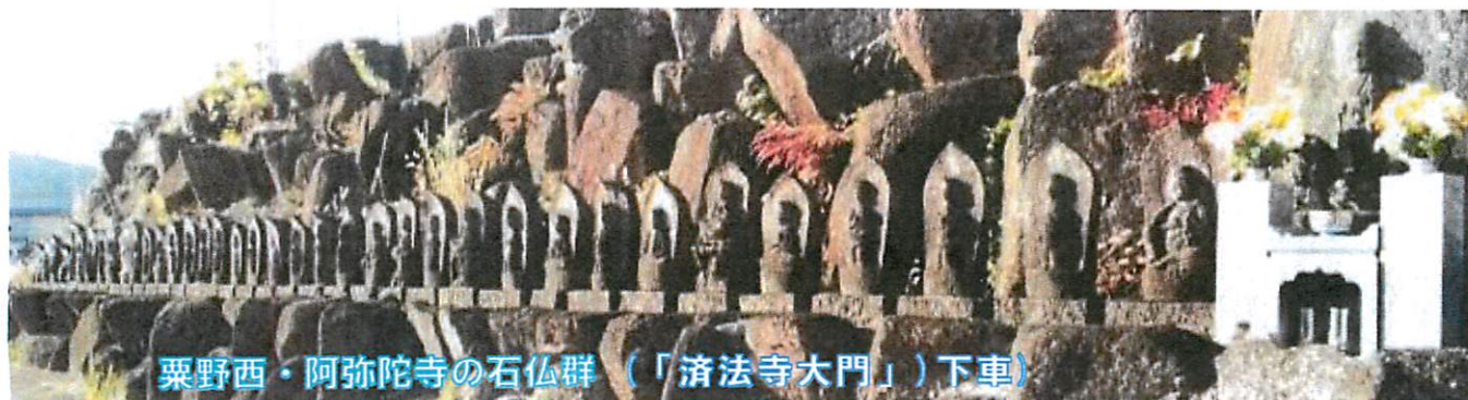
粟野西・阿弥陀寺の石仏群（「済法寺大門」）下車

私たちの地域には、貴重な歴史文化が息づいています。そんな地域の宝を、“ぐるっとバス”で訪ねます。 ※年号の判明している石仏は( )内に記載。