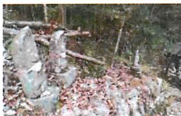
▲法華寺・観音堂付近の山道「三田洞神仏温泉」下車

法華寺観音堂の右奥の鐘戸山の山道から、標高 113m の頂上を経て、180 体を超える石仏が祀られています。四国巡礼信仰で、大正年間に人力で彫られたと言います。※山道の石段に落ち葉が積もり、滑りやすいので注意が必要です。