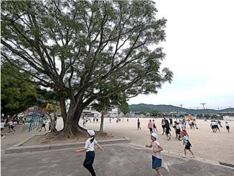
▲センダンの樹の下を元気に駆け抜ける児童たち (R7. 5. 16)